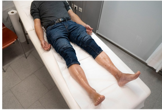
II. Posición del paciente