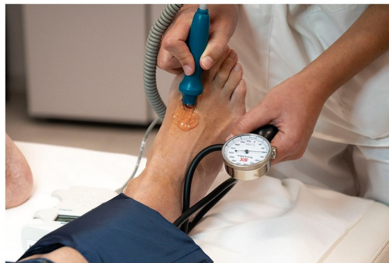
VI. Determinación de la presión sistólica de la arteria dorsal del pie