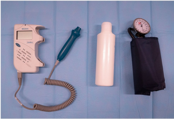
I. Medios materiales