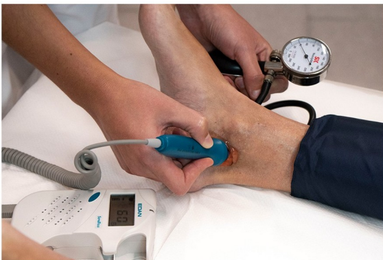
V. Determinación de la presión sistólica de la arteria tibial posterior