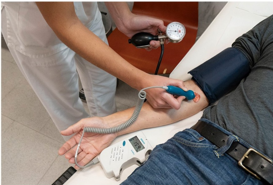
III. Determinación de la presión sistólica de la arteria braquial