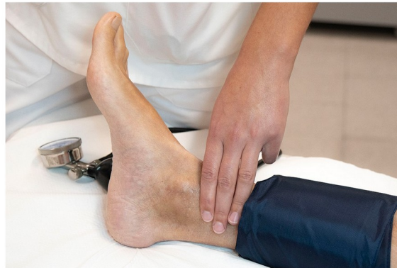
IV. Colocación del manguito de presión